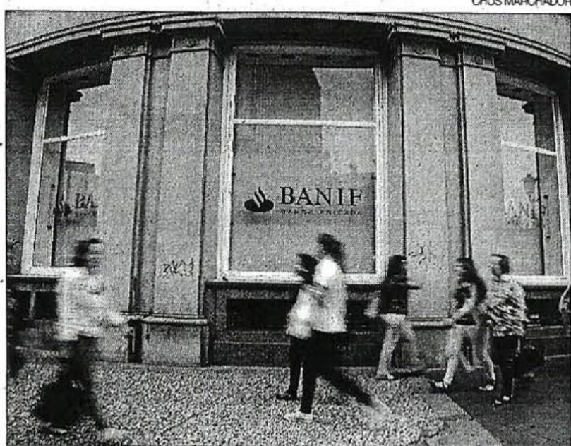
La sede del banco Banif en el Paseo Sagasta de Zaragoza.