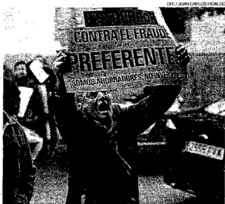
Un afectado por preferentes protesta ante los juzgados en Madrid.

La guerra judicial contra los bancos que engañaron a sus clientes endosándoles productos de alto riesgo, como acciones preferentes y subordinadas, ha dado un nuevo giro en favor de los consumidores. Los juzgados zaragozanos han dictado en los últimos meses cuatro nuevas sentencias que condenan al Popular Banca Privada (PBP) a devolver un total de 234.000 euros a ocho clientes aragoneses por las pérdidas que sufrieron tras invertir en dos ruinosos bancos islandeses (Kauþthing Bank y Landsbanki). Después de varios fallos más en su contra, la entidad ha decidido no recurrir estas condenas y asumir que actuó mal.